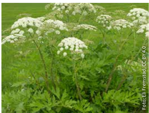
Tromsøpalme / kjempebjørnekjeks